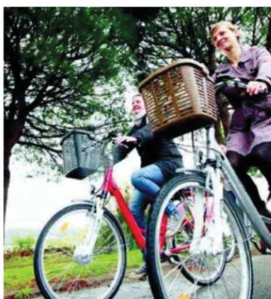
80 vélos sont mis à disposition à l'année à Bayonne.

Ils ne sont pas électriques mais n'en sont pas moins très utiles pour se