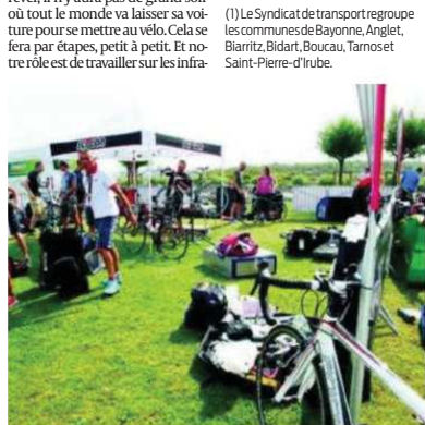
Fête du vélo se déroulera sur le site de l'esplanade de La Barre, qui avait accueilli La Haute route cet été.

Comment cela va-t-il se traduire ? Nous ne sommes pas partisans du principe de vélib'. D'ailleurs, beaucoup de collectivités en reviennent, et cela représente un coût énorme. On préfère partir sur quelque chose de nouveau à co-construire. Nous allons expérimenter la location longue durée de vélo à assistance électrique (VAE), avec l'objectif que les gens aient le temps de s'approprier ce nouveau mode de déplacement sur des trajets domicile-travail ou pour les loisirs, qu'ils puissent apprécier le gain de temps et d'argent en reconnaissant l'utilité de ces VAE. Cela en conduira certains à acquérir ce type de vélo. À terme, cela doit faire reculer l'usage de la voiture. Il ne faut pas rêver, il n'y aura pas de grand soir où tout le monde va laisser sa voiture pour se mettre au vélo. Cela se fera par étapes, petit à petit. Et le rôle est de travailler sur les infra-