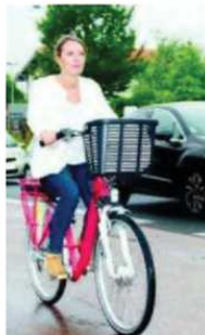
Le test s'est déroulé par une matinée nuageuse.

Qui ne s'est pas retrouvé un matin coincé dans les bouchons à regarder avec envie des cyclistes filant sans se soucier des aléas de la circulation ? Pratique, simple d'utilisation, économique et écologique, le vélo est un mode de déplacement séduisant. Reste que le territoire de l'agglomération est truffé de faux plats et vraies côtes, peut en rebouter plus d'un. Pour les encourager à franchir le pas, le Syndicat des transports de l'agglomération Côte basque Adour (Stacba) lance à partir du lundi 26 septembre un système de location longue durée de vélo à assistance électrique, également appelé « VAE ». L'objectif : permettre aux habitants de tester au quotidien l'usage de ce mode de transport alternatif, avant de franchir le pas. Nous avons pu le tester dans les rues de Bayonne.