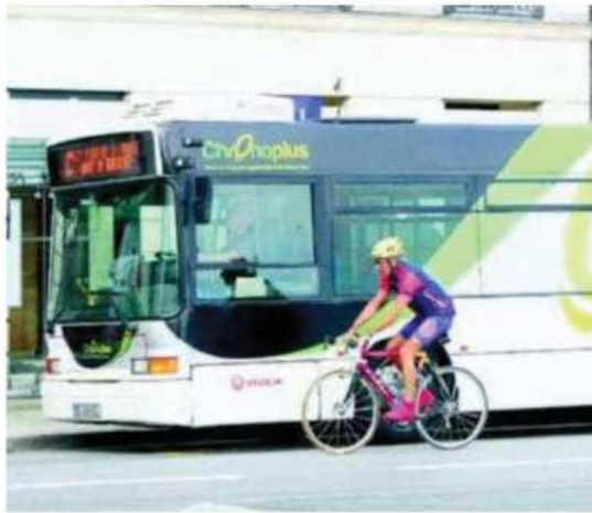
Chronoplus a connu un été sans fausse note.

Les deux lignes nocturnes (Noctoplus entre Bayonne et Biarritz, Paseo le long de la côte), complétées cet été par la ligne L (Bidart), ont elles aussi rencontré leur public. Près de 100 000 personnes ont emprunté