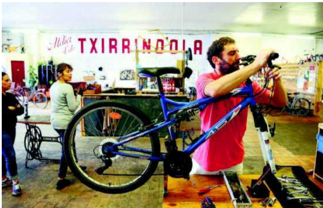
Aux allées Marines, on répare les vélos récupérés à la déchetterie ou via des dons pour leur donner une seconde vie à moindre prix.

« SUD OUEST » S'ENGAGE Notre journal est partenaire de l'opération nationale La France des solutions qui fédère 31 médias avec, comme objectif, la mise en valeur d'initiatives locales répondant aux enjeux contemporains. Demain, « Sud Ouest Dimanche » consacrera un dossier de huit pages à cette France qui agit, à travers une dizaine de reportages dans la région, et vous donne un avant-goût avec cette action citoyenne.